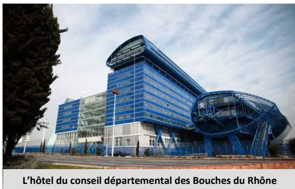
L'hôtel du conseil départemental des Bouches du Rhône

Que veulent faire les candidates et les candidats au Conseil départemental pour les personnes âgées ? C'est la question, que dans ce contexte, veut leur poser l'UTR des Bouches du Rhône.